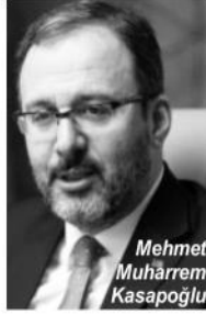
Mehmet Muharrem Kasapoğlu

Gençlik ve Spor Bakanı Mehmet Muharrem Kasapoğlu , ilk defa burs-kredi alacak 398 bin 173 öğrenciye toplam 680 milyon 603 bin TL ödeneceğini açıkladı. Gençlik ve Spor Bakanı Mehmet Muharrem Kasapoğlu , 2020-2021 öğretim yılı için burs-kredi başvurusu yaparak taahhütnamesini onaylayan öğrencilere öğretim yılı başı olan ekim ayından geçerli üç