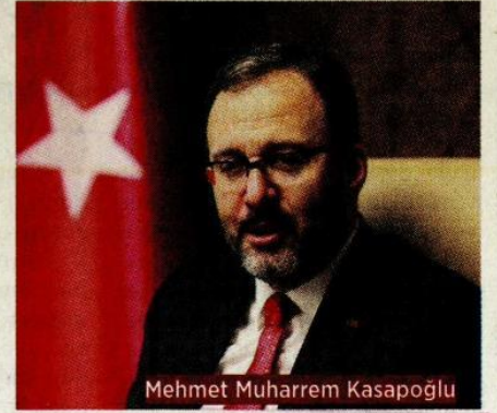
Mehmet Muharrem Kasapoğlu

öğrenciye toplam 680 milyon 603 bin 508 lira ödeme yapılacağını aktaran Kasapoğlu , TC kimlik numarasının sonu "0" olanların 28 Aralık'ta, "2" olanların 29 Aralık'ta, "4" olanların 30 Aralık'ta, "6 ve 8" olanların ise 31 Aralık'ta ödemelerini alabileceğini kaydetti.