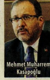
Mehmet Muharrem Kasapoğlu

Gençlik ve Spor Bakanı Mehmet Muharrem Kasapoğlu , yaptığı yazılı açıklamada 2020-2021 öğretim yılı için burs ve kredi başvurusu yaparak taahhütnamesini onaylayan üniversite öğrencilerinin, ekim ayından geçerli üç aylık burs ve kredilerinin bugün itibarıyla hesaplarına yatacağını duyurdu.